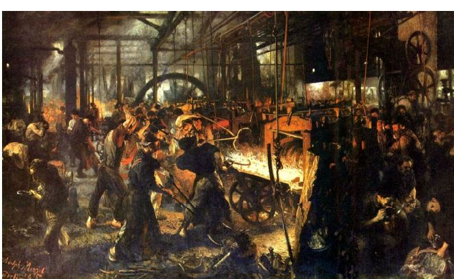
А.Менцель «Железопрокатный завод» 1875 г.