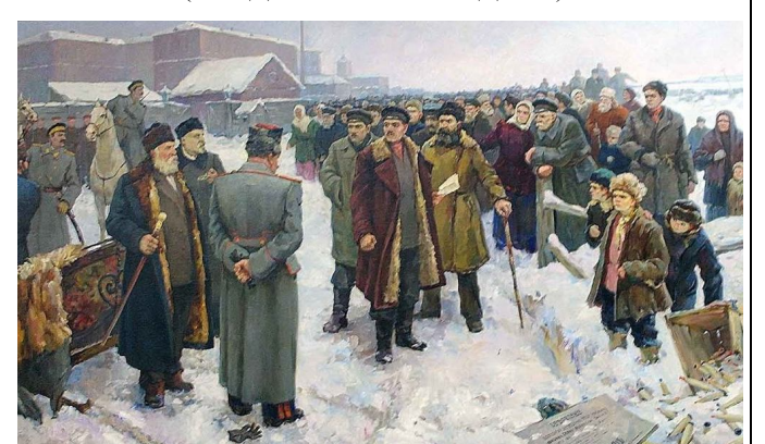
А.Куров «Морозовская стачка»