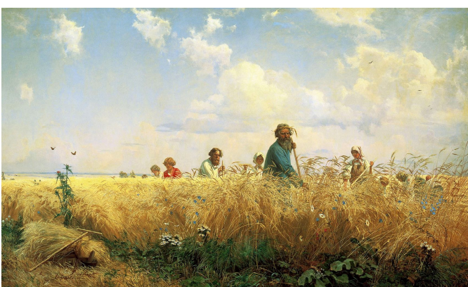
Г.Мясоедов «Страдная пора (Косцы)»